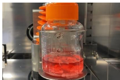
使用新型无纺布微载体的振荡培养

与生物反应器内没有搅拌桨、剪切力较小的振荡培养相结合后，效果尤为明显，不更换培养基也能在一周以内回收足够量的细胞。此外，由于无纺布具有多孔性，因此其表面积大，与其他支架材料相比，能实现更大规模的细胞培养。与传统的微载体珠相比，能在 4 天的培养期内令细胞数量增加 30%(*4)。( *4) 帝人富瑞特调查