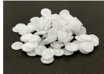
新型无纺布微载体

(1) 近年来，随着干细胞研究和再生医学的发展，再生医疗产品和生物医药产品不断走向实际应用，而细胞培养技术在扩大再生医疗产业时承担着重要作用。一般情况下，细胞培养主要采用用到培养皿或烧瓶的平面培养。然而，采用这种方法的问题是，细胞粘附面积小，培养几克组织就需要数百个培养皿，操作需要大量的设备、人员及工时。